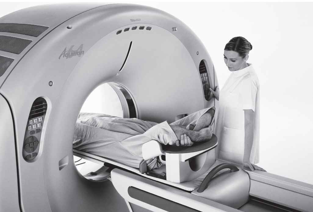
Computertomographie zeigt dreidimensionale Bilder des Körperinneren

«Vor jeder Therapie steht eine ganzheitliche Diagnose.» Diese einleuchtende Aussage, soll sie denn praktisch umgesetzt werden, erfordert medizinisches Fachwissen, geeignete Technik und ärztliche Intuition. Im Paracelsus-Spital Richterswil wird modernste apparative Diagnostik verbunden mit der ganzheitlichen Sicht auf den Menschen, wie sie die Anthroposophische Medizin seit jeher pflegt.