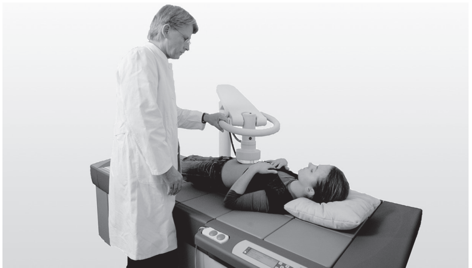
Lokale Hyperthermie als «Vierte Säule» der Krebstherapie